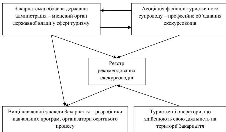
Рис. 1. Перший туристичний кластер Закарпаття, авторська розробка

Завданням цього кластеру стало об'єднання заради вирішення головної проблеми на ринку екскурсійних послуг – велика кількість фахівців туристичного супроводу (гідів, екскурсоводів, провідників у гори тощо), які не мають належної підготовки для проведення екскурсій на високому рівні, та відсутність контролю із боку органів влади за якістю надання послуг на ринку екскурсійних послуг.